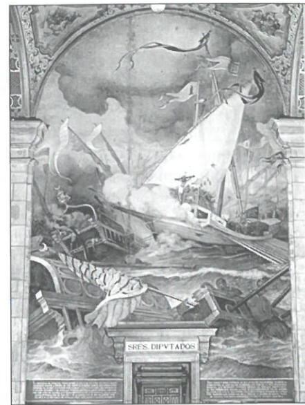
Así caerá el progresismo. «Jesús y adelante». Cristo vence. (La Batalla de Lepanto, de José M.ª Xiró, Barcelona)