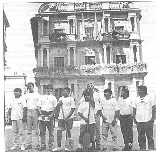
Los miembros de la expedición ante el ayuntamiento de Pamplona donde fueron recibidos por el alcalde.