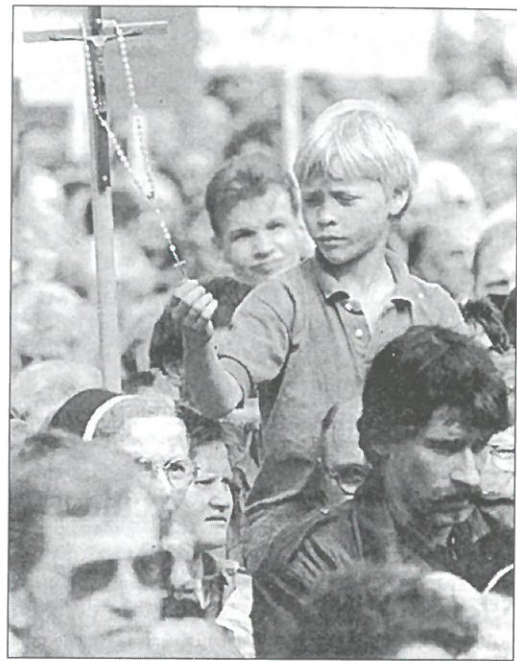
Personas de todas las edades participaron en la manifestación

Que afrontar la reconstrucción de un edificio es, ante todo, afrontar el problema de su cimentación. Las verdaderas «opciones» sobre la distribución de sus habitaciones o el color de su fachada vienen después, mucho después.