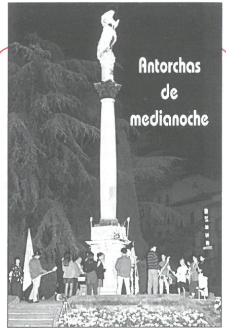
Antorchas de medianoche

(1) Las noticias de este resumen están tomadas de la obra «Historia de las Cruzadas», de M. Michaud, 7.ª ed. francesa.