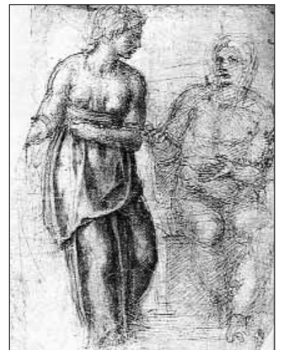
“Cristo y la mujer de Samaria” de Miguel Ángel

CUARESMA: PURIFICACIÓN PENITENCIAL para la PASCUA