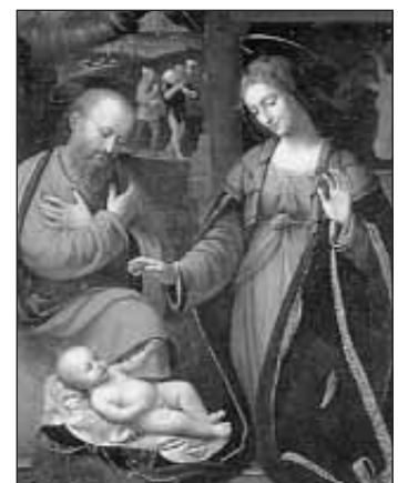
NATIVIDAD (Bernardino Luini, S. XVI).

Tarjetas de felicitación con motivos religiosos editadas por organizaciones CATÓLICAS