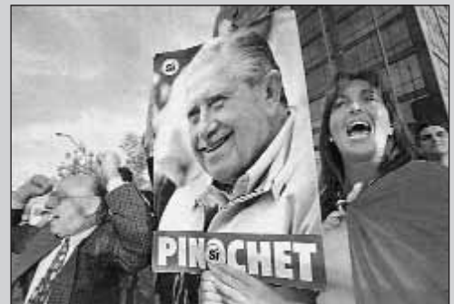
Los partidarios de Pinochet han salido a las calles protestando contra la decisión del juez Garzón.