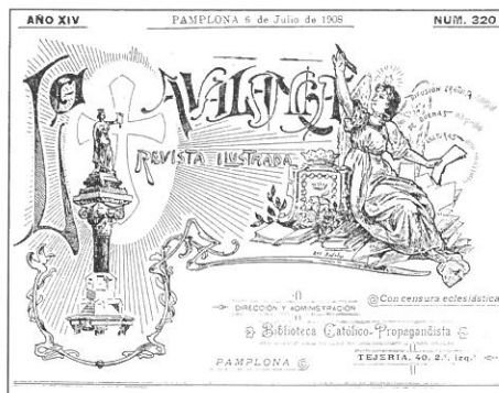
Portada de 6 de julio de 1908.

Pero " La Avalancha " sobre todo rezaba sobre virtudes naturales y cristianas, teología popular, la vinculación entre España y la religión, la defensa de la civilización católica, la Unidad Católica. Como tal, no tenía un carácter teórico sino práctico , referido a la política, la sociedad, el periodismo, el ámbito laboral y las costumbres cristianas. " No te hablaré de política, cosa que tú no entiendes ni yo tam-