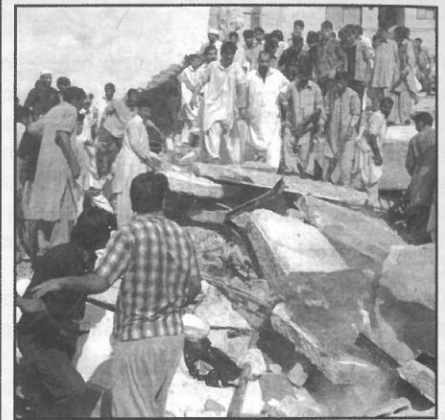
En la imagen, decenas de hombres buscan supervivientes entre los escombros de un bloque de 75 apartamentos que se desplomó en Islamabad, la capital paquistaní.

El fuerte terremoto registrado el 8 de octubre en Pakistán dejó una estela de destrucción con un número de muertos que podría elevarse a 30.000, decenas de personas atrapadas entre los escombros, interrupción de las comunicaciones y centenares de paquistaníes sin hogar. En la India , en la zona de Cachemira, causó al menos 252 muertos. El seísmo se dejó notar igualmente en algunas zonas de la vecina Afganistán . En Islamabad se registró un éxodo de residentes de inmuebles altos, después de que una conocida torre con 75 apartamentos se desplomase a causa del seísmo, dejando decenas de personas atrapadas. (Efe)