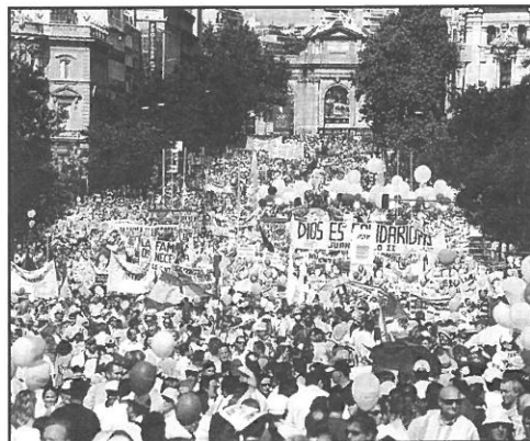
El pasado 18 de junio más de un millón de personas recorrieron Madrid en favor de la familia.

Casi cinco meses después de la manifestación de la Iglesia el 18 DE JUNIO contra las bodas gays, los católicos salen de nuevo a la calle contra la Ley Orgánica de Educación (LOE). Será el día 12 de noviembre al mediodía en Madrid, en una marcha de protesta convocada por la Confederación Nacional de Padres de Alumnos (Concapa), el sindicato USO, la patronal Confederación Española de Centros de Enseñanza (Cece) y tres organizaciones más. La última palabra de la Federación de Religiosos de la Enseñanza (FERE) no está todavía dicha. Coincide con las entidades convocantes de la marcha del 12-N en la mayoría de sus planteamientos, pero