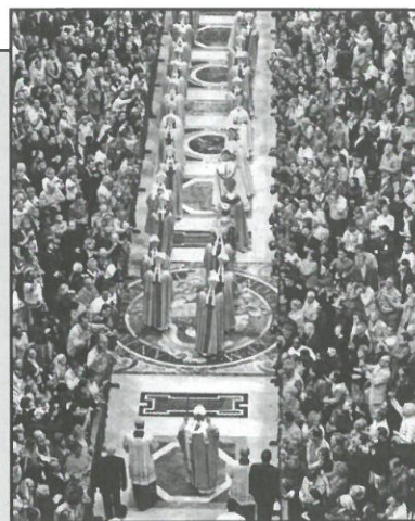
La XI Asamblea General del SÍNODO DE LOS OBISPOS , que, como clausura del AÑO DE LA EUCHARISTÍA, reúne en Roma a 256 prelados de 118 países hasta el próximo 23 de octubre, inició el 3 de octubre sus trabajos después de la Eucaristía de inauguración que tuvo lugar el domingo día 2 en la Basílica de San Pedro del Vaticano, presidida por el Papa Benedicto XVI .