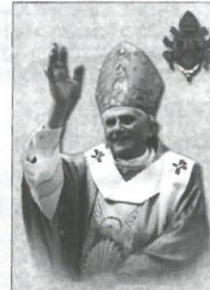
AUDIENCIA CON EL SANTO PADRE INCLUIDA