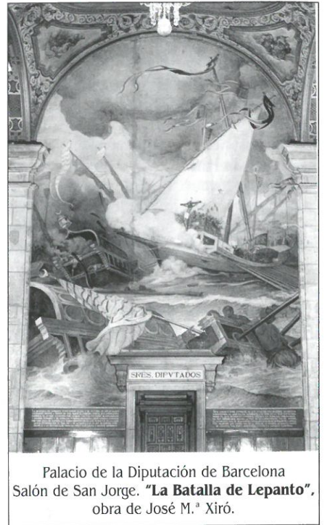
Palacio de la Diputación de Barcelona Salón de San Jorge. "La Batalla de Lepanto", obra de José M.ª Xiró.

LA SITUACIÓN, HOY. - Turquía es un país musulmán. Pero ha aceptado, formula-riamente, que su Estado sea laico, como condición impuesta por los artífices de la