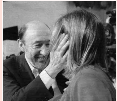
Rubalcaba acaricia victorioso a Chacón

Alfredo PÉREZ RUBALCABA fue elegido secretario general del PSOE el 4 de febrero por los votos de 487 delegados frente a los 465 que obtuvo Carme Chacón . Pérez Rubalcaba puso el auditorio en pie cuando anunció que « el PSOE se planteará seriamente el acuerdo con la Santa Sede » si el Ejecutivo de Mariano Rajoy sigue en la línea de «retroceder 30 años» con sus «recortes de derechos», entre los que citó el copago sanitario, la eliminación de la asignatura de Ciudadanía y muy particularmente, la revisión de la ley del aborto. Lo hizo pasada la mitad de su discurso, animado por la buena respuesta con la que el público iba acogiendo sus críticas al PP, y que remató con un reto enigmático: «Si quieren retroceder 30 años, retrocedamos en todo..., reconsideraremos nuestros principios, que han sido muy sensatos». (Efe)