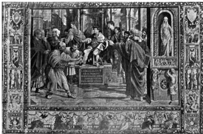
L SERGIVS PAVLVS ASIAE PROCOS CHRISTIANAM FIDEM AMPECTITVR SAVLI PRAEDICATIONE. Sergio Paulo, procónsul de Asia, abraza la fe cristiana por la predicación de Saulo.

do cubriendo una de las enormes paredes de piedra de un patio cerrado del Palacio de Oriente.