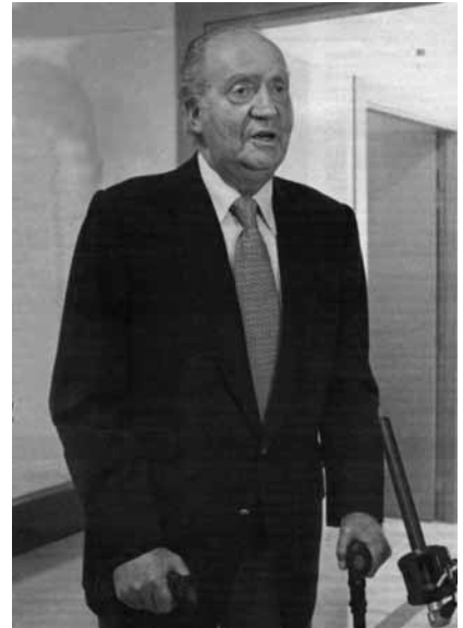
Don Juan Carlos se dirigió a un grupo reducido de medios públicos tras recibir el alta médica después del accidente de cacería en Botsuana, y en un gesto sin precedentes pidió perdón

¿Qué valor trascendental supone el “no volverá a ocurrir” la equivocación de irse de caza de elefantes a Botsuana, si en su Patria, que es su Reino, se les impide anualmente el derecho a vivir a 151.000 nasciturri que Dios quiere que sean súbditos del Rey de España? Este año 2012, se va a reproducir la misma matanza legal de inocentes que el año 2011? ¿No es capaz de decir, “lo siento mucho. Me he equivocado. Y no volverá a ocurrir”? Si por matar un elefante en Botsuana, se ha visto obligado a reconocer humildemente su equivocación, lo que le agradezco, porque le duele que la monarquía haya quedado tocada, al sentir del Pueblo Español, también dijo con mucha más