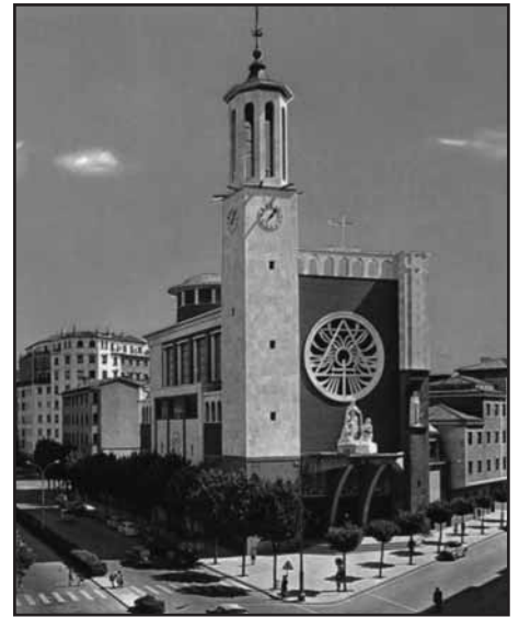
Parroquia de San Francisco Javier

Los que entonaban el último domingo canciones religiosas en el templo para, cantando y rezando, impedir a monseñor Cirarda hablar y poder así manifestar su protesta por la justicia y la fidelidad, eran los mismos que el domingo anterior rezaban fuera de la sacristía y preguntaban dentro sin obtener respuesta. Que no fue «secuestro» el insistente «que se vayan», «que se vayan» al párroco y al adscrito en la sacristía, grito claramente dirigido este