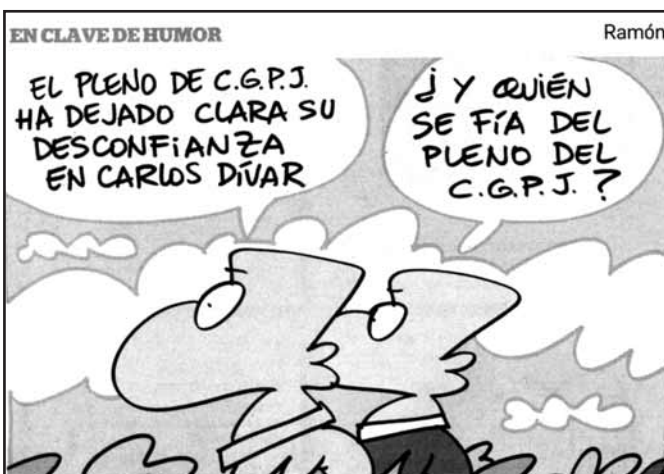
Véase Ojeando, pág. 12