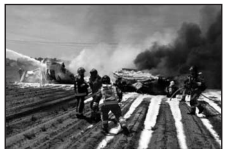
El trabajo de los bomberos.

El guarda del coto de caza donde se estrelló el aparato presencié el siniestro y se lanzó al rescate. Con su acto de valentía el testigo logró sacar vivos de entre las llamas a dos de los tripulantes del A400M accidentado. Este modelo, el mayor avión militar de hélice del mundo con cuatro motores, despegó a las 12.45 horas, detectó un fallo y pidió permiso para volver a tierra. Pero, a solo una milla del aeródromo, chocó con una torre de alta tensión. Efe.