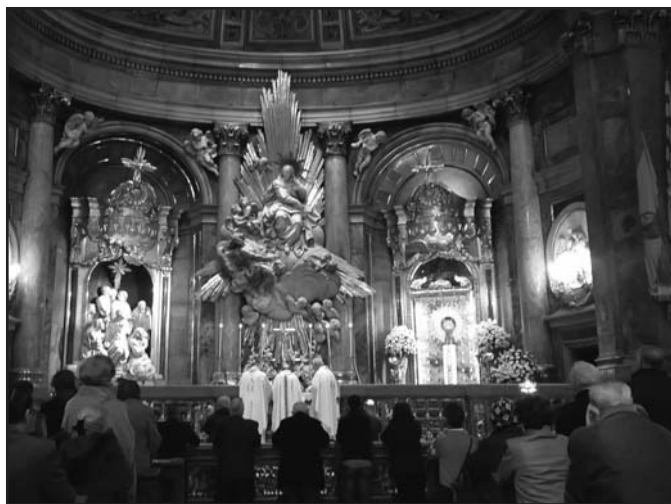
Nuestra Misa concelebrada el 2 de abril en EI PILAR (JFG)