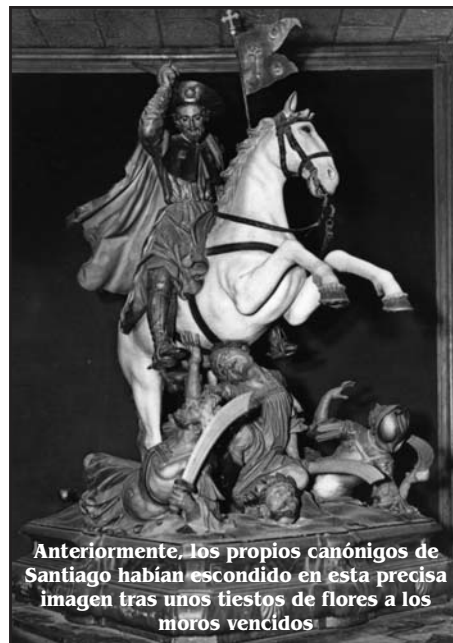
Anteriormente, los propios canónigos de Santiago habían escondido en esta precisa imagen tras unos tientos de flores a los moros vencidos

Los sacramentos son el medio que Dios ha inventado para que estemos realmente en relación con Él. Cuando soy bautizado me sumerjo en la Trinidad, como dijo el Papa Benedicto XVI. Cuando recibo el Cuerpo de Cristo, es verdaderamente Cristo que entra en mí y