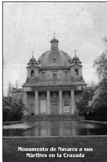
Monumento de Navarra a sus Mártires en la Cruzada